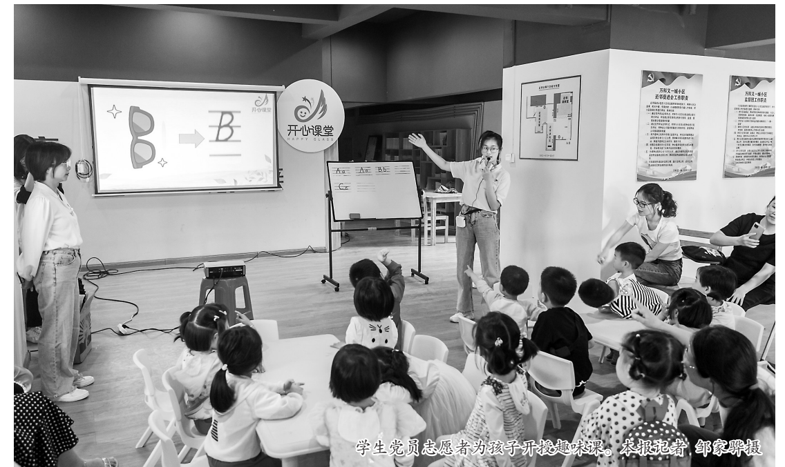
学生党员志愿者为孩子开设趣味课。