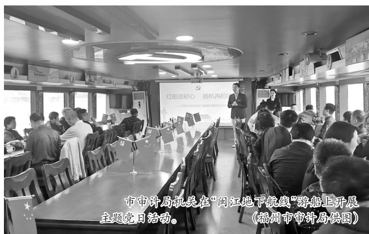
市审计局机关在“闽江地下航线”游船开展主题党日活动。

乘坐“闽江地下航线”游船聆听红色故事,到潮江楼学习中国工人运动先驱王荷波“品重柱石”的红色生涯……近期,福州审计机关深入贯彻落实习近平总书记来闽考察重要讲话精神,以开展党史学习教育作为贯彻落实习近平总书记“以审计精神立身,以创新规范立业,以自身建设立信”总要求的重要抓手,坚持“3820”战略工程思想精髓,把党史学习教育作为传承红色基因、坚守初心使命的一场重要精神洗礼,作为激励干事创业、开创新局的一次强力赋能,通过开展丰富多彩、形式多样的活动,引导审计干部切实做到学史明理、学史增信、学史崇德、学史力行,以昂扬姿态加快建设现代化国际城市,用汗水和实干把宏伟蓝图变成美好现实。