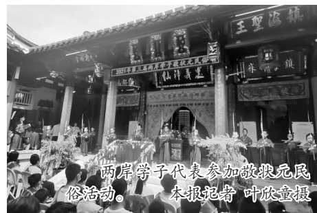
两岸学子代表参加敬状元民俗活动。

本报讯(记者 叶欣童)昨日上午,第三届两岸学子敬状元民俗活动在上下杭万寿尚书庙举行。活动以“共同的信仰 文化的根脉”为主题,吸引数十名两岸学子参与,共同体验福建省级非遗项目陈文龙信俗。