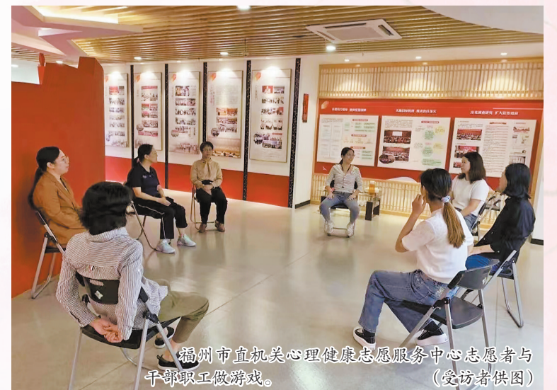
福州市直机关心理健康志愿服务中心志愿者与干部职工做游戏。

这背后,是一股“她”力量。成立4年多来,市直机关心理健康志愿服务中心招募、孵化了一支优质、专业、满足各种心理需求的咨