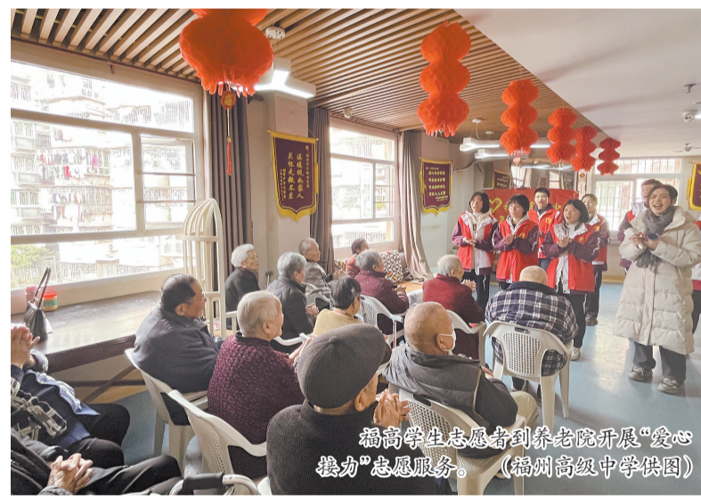
福高学生志愿者到养老院开展“爱心接力”志愿服务。

福州高级中学坐落于风景优美、历史悠久的烟台山。近年来,学校因地制宜成立了志愿服务新品牌——烟台山闽海关税务司官邸志愿服务讲解。每周六,福州高级中学志愿者们都会前往闽海关税务司官邸开展文化讲解、文明劝导以及指导预约扫码等志愿服务活动。