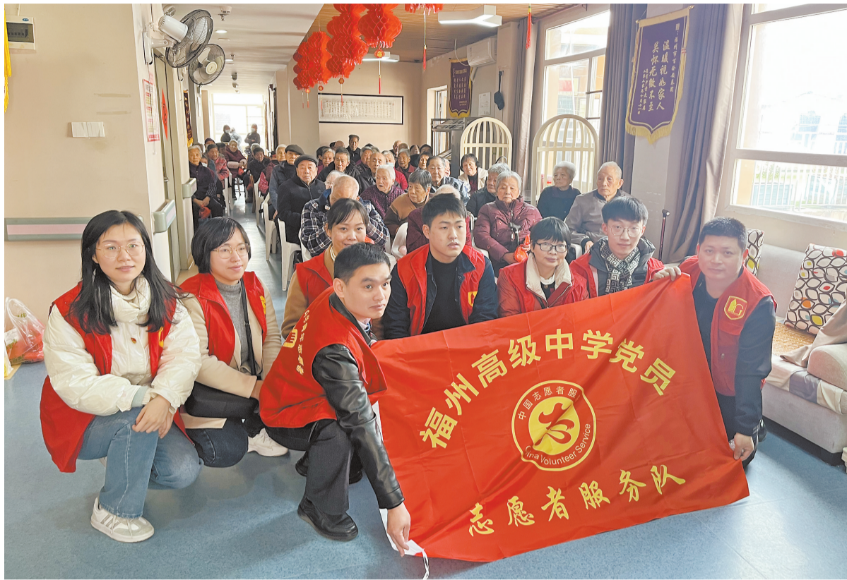
福高学生志愿者到养老院开展“爱心接力”志愿服务。

60年来,雷锋精神薪火相传。1963年,福州高级中学成立学雷锋志愿服务队。2023年,在第60个“学雷锋纪念日”到来之际,福州高级中学开展了一系列学习雷锋志愿服务活动,掀起“学习雷锋”热潮。雷锋精神不仅滋养着一代代福高师生的心灵,也在一代代传承中绽放新的光芒。