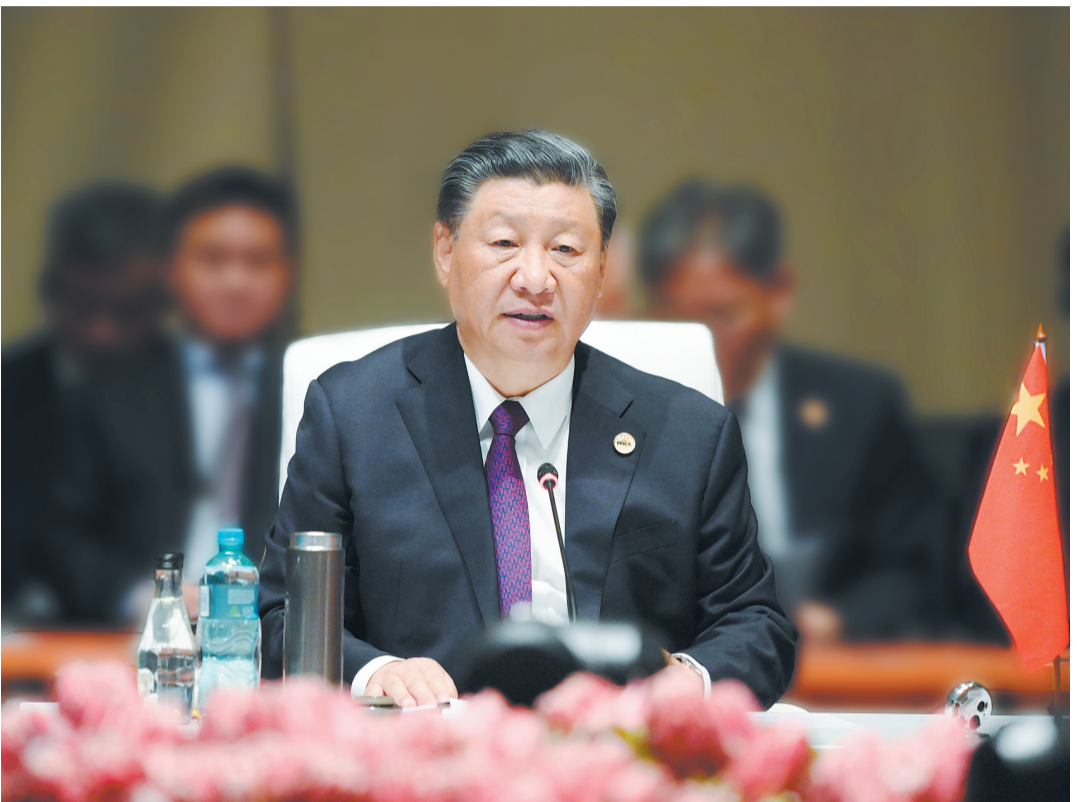
当地时间8月23日上午，金砖国家领导人第十五次会晤在约翰内斯堡滕滕会议中心举行。南非总统拉马福萨主持会晤。中国国家主席习近平、巴西总统卢拉、印度总理莫迪和俄罗斯总统普京（线上）出席。习近平发表题为《团结协作谋发展 勇于担当促和平》的重要讲话。