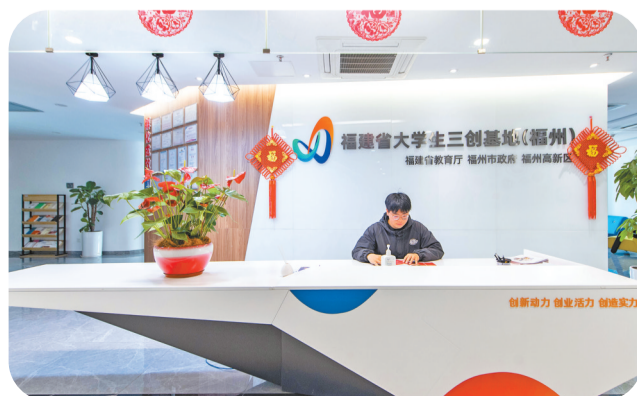
位于高新区的福建省大学生三创基地。