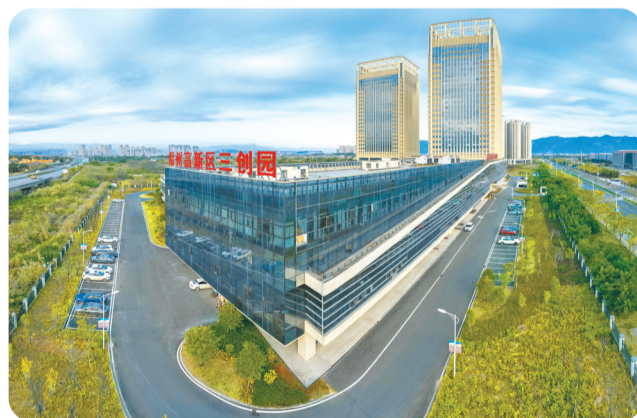
福州高新区三创园。

高新区已汇集23万师生人才,集聚青年创客5000多人,引进各类人才1000多人,其中中科院院士、国家级重点专家、省级以上专家120多人