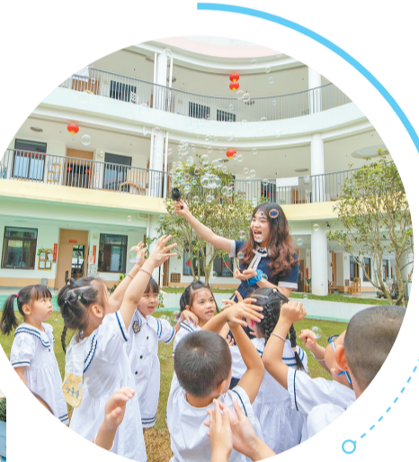
福州高新区实验幼儿园师生在校园里嬉戏。