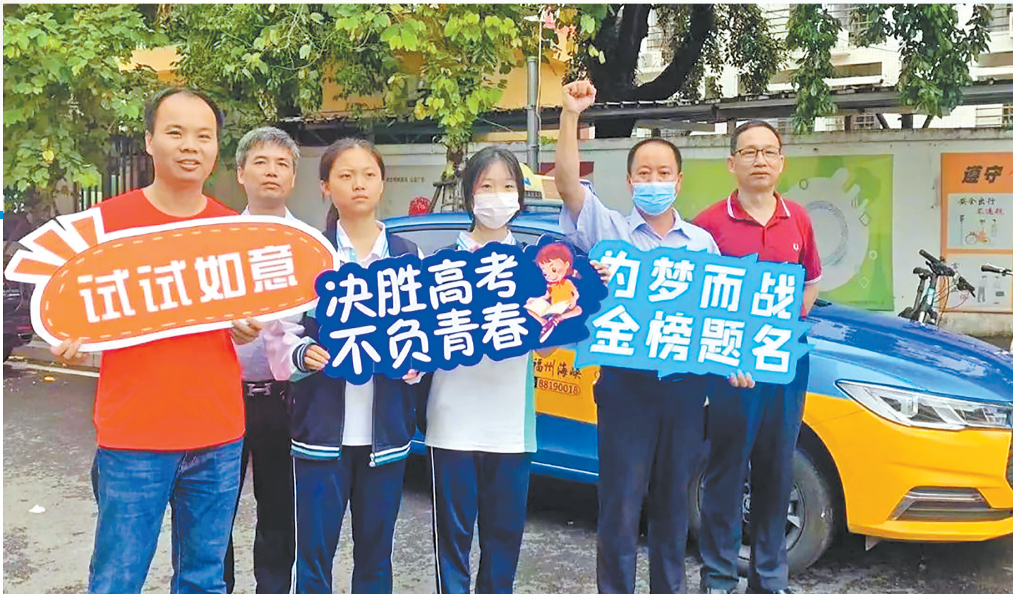
海峡出租车司机参与爱心送考活动。