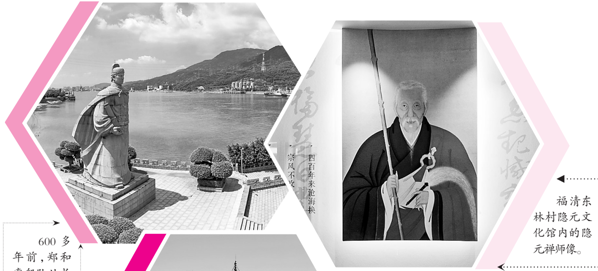
福清东林村隐元文化馆内的隐元禅师像。

郑和最后一次出海223年后,福州僧人,福清黄蘗山万福寺隐元禅师由郑成功派遣船只护送,东渡日本,在异国开创了一个新的文化纪元。 日本京都黄蘗山万福寺与福清的寺名一样,寓意着隐元禅师对故土福州的无尽思念。 据福清黄蘗山万福寺方丈定明法师介绍,自1654年隐元禅师应请东渡日本开创黄蘗宗以来,共有16任方丈从福清黄蘗山漂洋过海,赴京都黄蘗山任住持。此外,还有近80位高僧被写入传法的传记中。 在日本,除了开创了日本禅宗三大宗派之一的黄蘗宗,隐元禅师和历代黄蘗禅师还为日本带去工程建设、书法绘画、医学医药、雕刻出版、饮食烹饪等各种文化,日本社会统称其为黄蘗文化。黄蘗文化内涵丰富,涉及文学、音乐、美术、建筑、医药、饮食、民俗等诸多领域,对江户时代日本经济社会发展产生了重要影响,并延及后世。例如隐元带去的明代煎茶法,后来发展为日本煎茶道。时至今日,日本煎茶道联盟共同尊隐元为煎茶始祖,每年的煎茶大会也都在京都黄蘗山举行。隐元禅师还从福清带了许多茶种到日本,如四季豆、小白菜等,时至今日,当地人仍称其为“隐元豆”“隐元菜”。 “随着时间和空间上的长期传承和融合,黄蘗文化既具有中华正统文化的共性,也具有福州区域文化的个性,尤其是具有鲜明的海洋文化的包容和开放等特征。”福清黄蘗文化促进会会长林文清说。 2022年10月,《黄蘗文化:中日