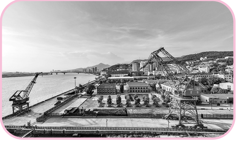
位于马尾的中国船政文化园。

中国人民历来重视友好交往,2000多年前,福州先人穿江越海,劈波斩浪,开拓出一条绵延万里的“海上丝路”。闽安、新港、洪塘、淮安……这些福州的古港口,见证了福州“百货随潮船入市,万家沽酒户垂帘”的辉煌历史,也镌刻着中华民族和海上丝绸之路沿线各国人民友好交往的永恒记忆。 福州是我国著名侨乡,从县石山开始,福州人向海外进发的步伐就没有停止。近代以来,福州的海外移民数量激增。这些移居海外的乡亲,不仅成为向海外宣传福州的重要窗口,也积极支持家乡的发展。据统计,目前海外和港澳台地区福州籍乡亲有500万人左右,遍布世界180多个国家和地区。毫不夸张地说,在世界各地,有海外的地方就有福州人。 直到近代,福州人跨越山海,和异国人不断续写友好交往新篇章。1910年,62岁的黄乃裳带着福州基督教青年会会长后,于1912年在苍霞洲筹建新会所。黄乃裳筹集资金5万余元,美国总统西奥多·罗斯福捐资12