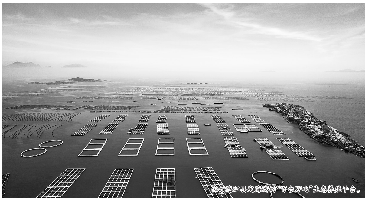
位于连江县定海镇的“百合万吨”生态养殖平台。

向海而生,辽阔的大海为福州的鼎盛历史人文掀开了壮丽的舞台。五千年前,从县石山出发,福州人就向海进军,在太平洋岛国开枝散叶。两千年前,福州先民劈波斩浪,开拓出一条绵延万里的“海上丝路”。 汉初福州名为“东冶”,东冶港已经是中国东南沿海著名的港口;闽人“三十六姓”出使琉球,文化传播数百年,影响深远;创造了世界航海壮举的郑和船队,七次下西洋前都在福州驻泊,伺风开洋;陈元禅师跨海东渡,在异国他乡开创了禅宗新时代。 船政百年,为中华民族奔向现代化铺路引航;黄乃裳带着1000名福州人,在马来建了一座新“福州城”;至今500万福州籍乡亲遍布世界180多个国家和地区……福州文化骨子里就带着海洋博大宽广的基因,塑造了“海纳百川,有容乃大”的城市精神。 20世纪90年代初,习近平同志主政福州期间,就高瞻远瞩地提出建设“海上福州”的发展战略。他指出:“福州的优势在于江海,福州的出路在于江海,福州的希望在于江海,福州的发展也在于江海。”