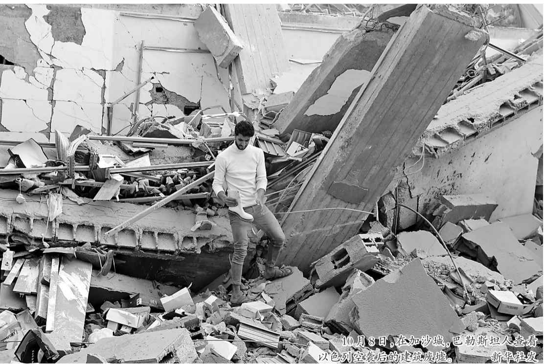
10月8日,在加沙城,巴勒斯坦人查看以色列空袭后的建筑废墟。