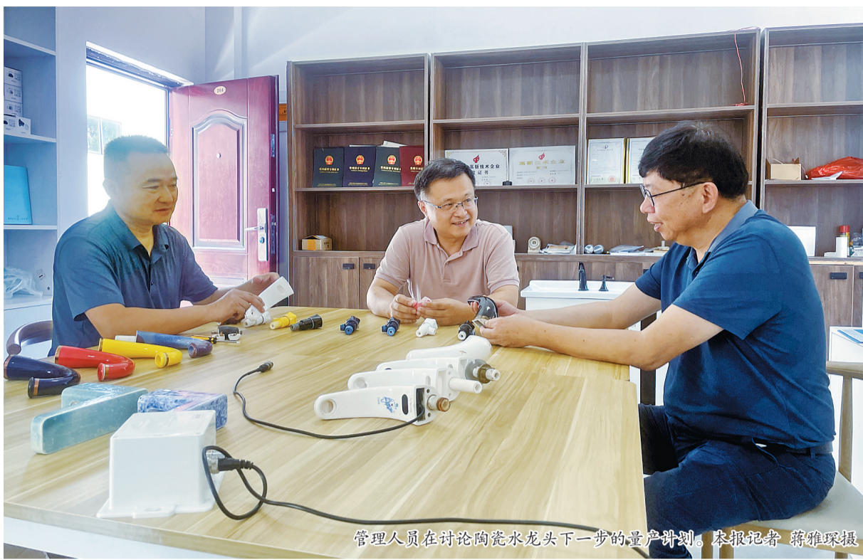
管理人员在讨论陶瓷水龙头下一步的量产计划。

在双手的作用下,土、水、火交织在一起,形成质的转换,成就了丰富多彩陶瓷文化。数千年来,伴随着华夏文明的发展,陶瓷不断演化,创造无数惊喜。时至今日,这捧陶土还能如何演绎创新?在瓷都闽清,记者找到了答案——闽清雅中瓷业有限公司十年磨一剑,成功研发出一种陶瓷水龙头,工艺全面突破,霎时惊艳业界。