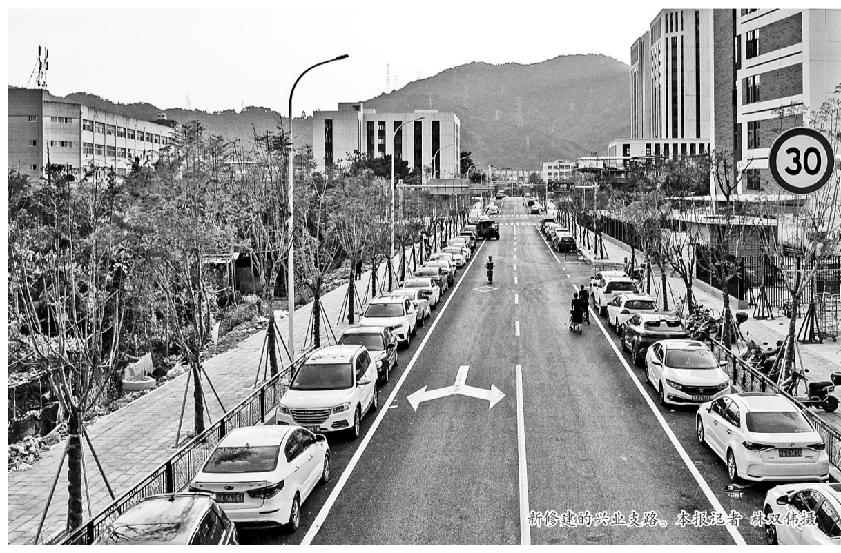
新修建的兴业支路。

高质量发展,从来不是空中楼阁,必须立足产业实际,锚定科技创新。在福州高新区,福建省柔性电子科学与技术创新实验室(海峡创新实验室),犹如一股强劲力量指向这片园区的未来:推动高新区电子相关产