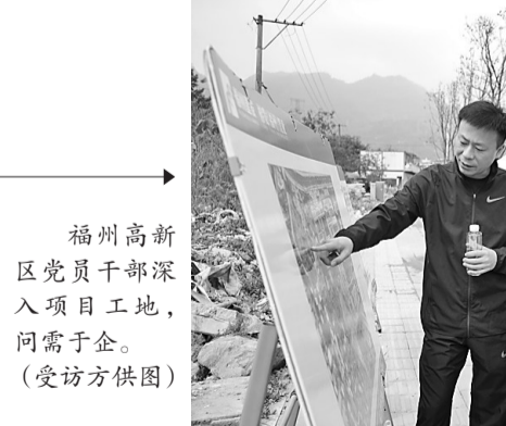
福州高新区党员干部深入项目工地,问需于企。