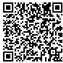
扫码观看晚会相关视频等。

凡是过往,皆为序章。站在新的历史起点上,长乐区委、区政府将不忘初心、牢记使命,团结带领长乐人民,在“3820”战略工程思想精髓的引领下,加快建设现代化国际城市领航区,全力打造生态创新宜居的现代长乐、国际航城,为奋力谱写中国式现代化长乐新篇章而努力奋斗。