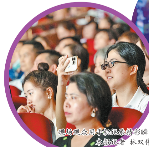
现场观众用手机拍摄精彩瞬间。

本场晚会由国家级、省级、市级、区级文艺团队四级联动,携手打造,福建省歌舞剧院、中共长乐区委宣传部、福州日报社倾情策划,联合发力,前央视春晚资深导演邹友开,著名导演、影视制作人于惠执导,邀请到中国著名配音演员、国家一级演员徐涛、中央歌剧院青年女高音歌唱家王庆爽、福建省歌舞剧院院长孙砾、中国戏剧梅花奖得主陈琼、中国花腔女高音歌唱家常思思等倾情参演,还有400多名演员同台演绎,舞台阵容强大。