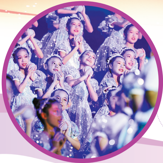
童声朗诵、表演唱《萤火虫》。

流光溢彩,盛世欢歌。26日晚,星光璀璨,歌声嘹亮,“千年古邑 长安久乐”庆祝长乐建县1400年大型主题文艺晚会在长乐区人民会堂激情上演,各界干部群众齐聚一堂,演员们以歌唱、舞蹈、朗诵、杂技