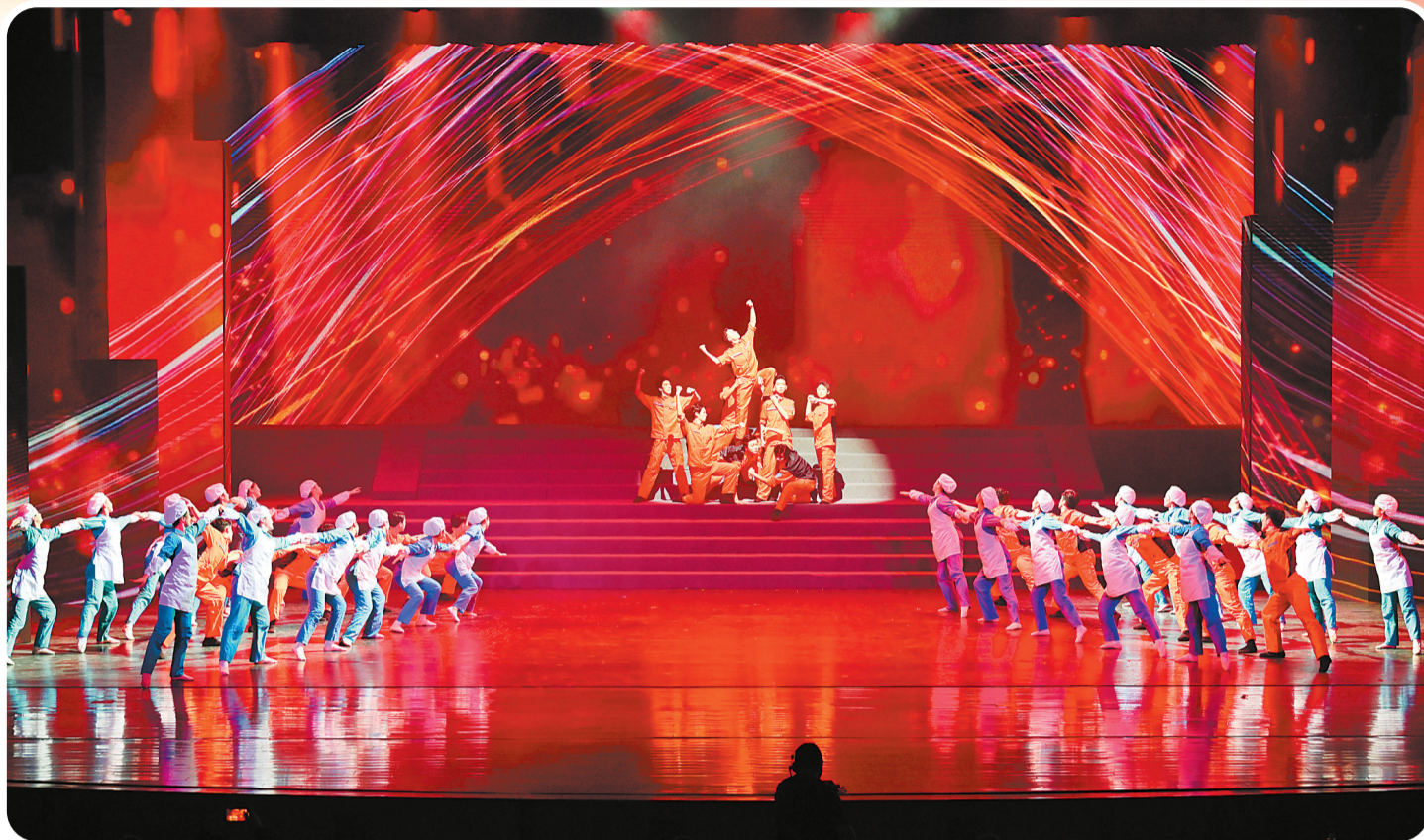
表现长乐产业发展的现代舞《织梦铸魂》。

“整场晚会亮点纷呈,看了让人热血沸腾,热泪盈眶!”“由衷地为长乐发展取得的成就点赞!”“晚会太精彩了,我为家乡长乐感到自豪!”网友纷纷评论。