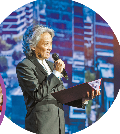
配乐诗朗诵《山海的女儿》。