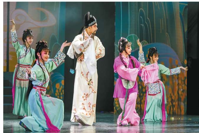
闽剧《马铎一日君》。

如何将1400年的奋斗历程浓缩在120分钟的节目里?邹友开为了这次晚会两次来长乐采风,历时数月筹备,每个作品都反复遴选,光台本就打磨了8次。