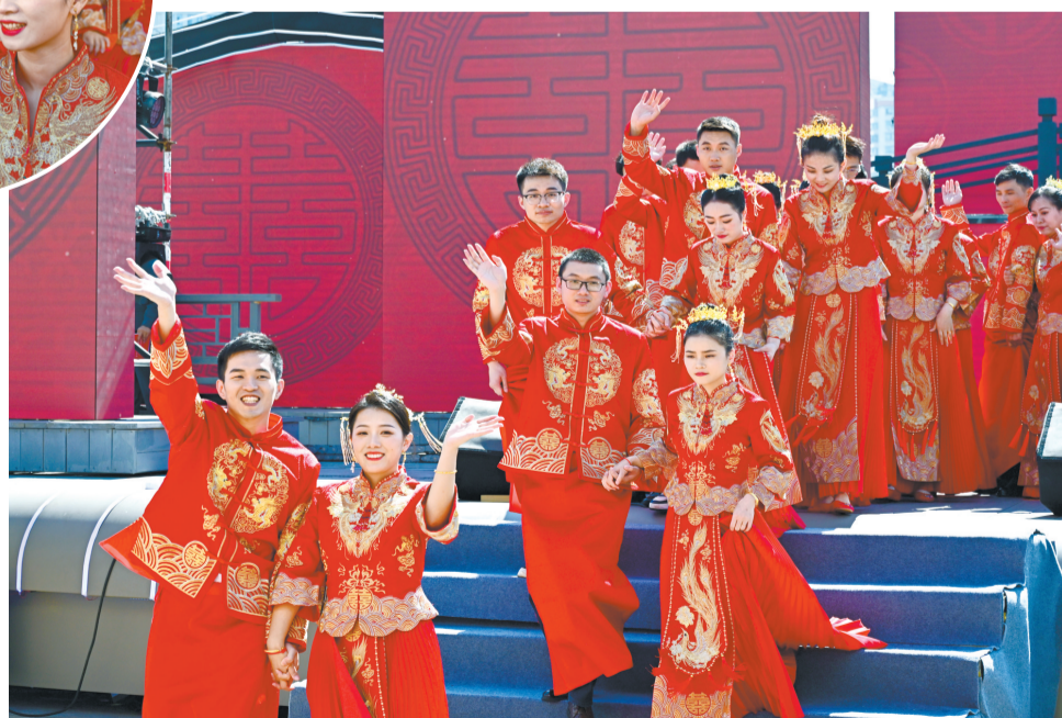
幸福的新人们集体亮相。

一曲鼓乐吹笙,一声闽剧萦绕,一群喜娘喝彩……3日上午,2023年新福州人集体婚礼在“城市会客厅”闽江之心海丝广场隆重举行。百对新人望福山、临福水、享福地、行福事,在“天下福地‘福’爱榕城”的祝福声中圆满完成集体婚礼,收获人生难忘记忆。在这甜蜜的日子里,都有哪些难忘瞬间?新人们又分享了怎样的幸福感受?一起来看看吧。