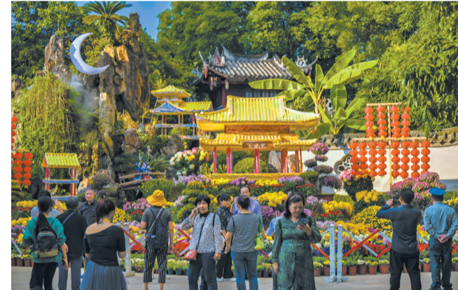
初月菊影(开化屿假山)景点。本报记者 陈暖暖

本报讯(记者 唐蔚楠)昨天,主题为“菊耀榕城、花开西湖”的第60届西湖菊花展拉开序幕。本届菊展是西湖近8年来规模最大的的一次花展,展出近千个菊花品种,共近4万盆。20处展点分布于西湖公园和左海公园。展期将持续到26日。