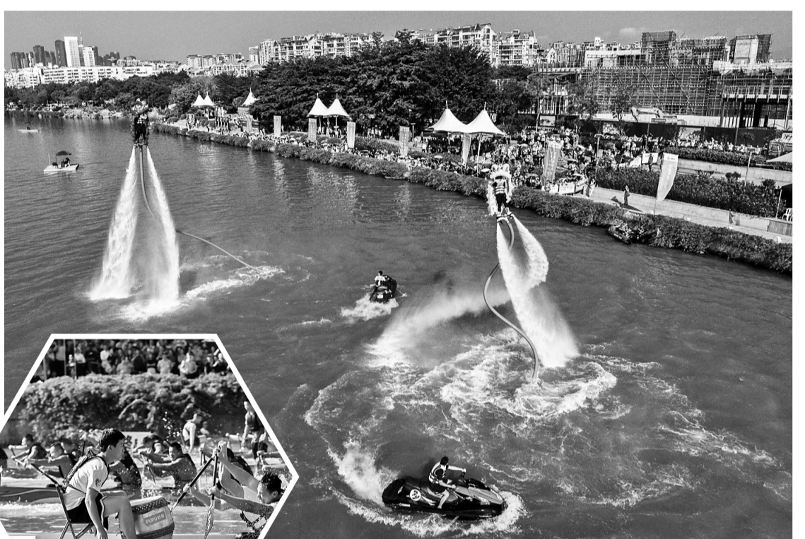
▲“水上舞狮”特技表演。