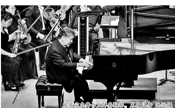
殷承宗在舞台上弹奏钢琴。

本报讯 4日晚,国际钢琴大师殷承宗携青年指挥家尹炯杰、厦门爱乐乐团走进全国巡演福州站,为榕城市民带来一场音乐盛宴。