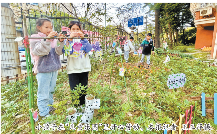
小孩子们在“儿童乐园”里开心劳动。

两个月前,这里是另一番模样:光秃秃的土地上散落着不少石块,与小区环境十分不协调。变化得益于“五社联动”(即以社区为平台、社会工作者为支撑、社区社会组织为载体、社区志愿者为辅助、社区公益慈善资源为补充的新型社区治理机制),入驻社区的仓山区小茉莉青少年事务社工中心在民政部门的支持下,牵头策划了“社区一分地”工作坊项目,发动居民参与社区治理,打造共建共享空间。