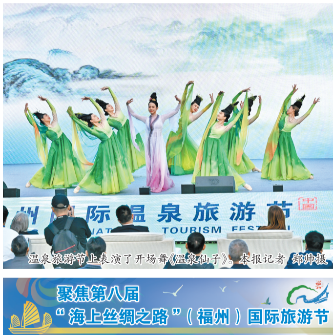
温泉旅游节上表演了开场舞《温泉仙子》。