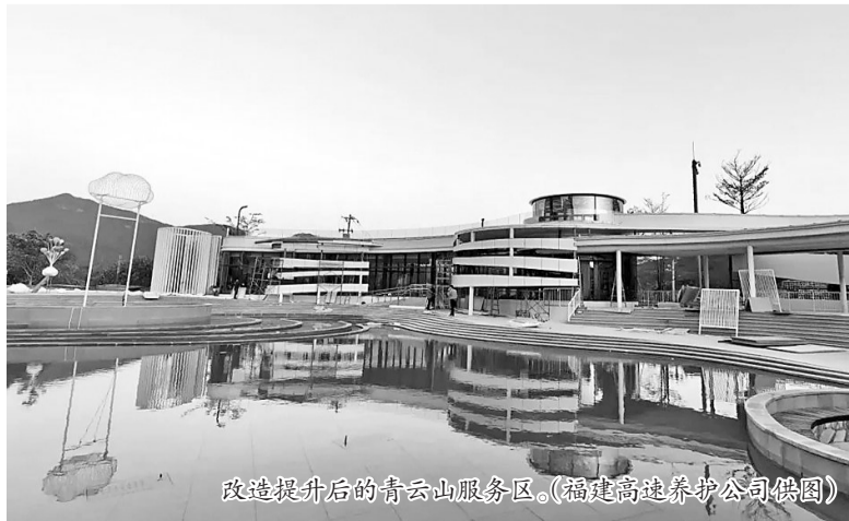
改造提升后的青云山服务区。

在本次改造中,青云山服务区总建筑面积扩至约8502平方米,绿地面积扩至25433平方米,特别引入智慧公厕、智慧停车及多个娱乐互动模块,停车场车位增至367个,实行客货分离,并设置了不同车型的停车位;公共卫生间厕位增至80个,还设有无障碍卫生间、母婴室等,为司乘人员提供温馨周到的服务。