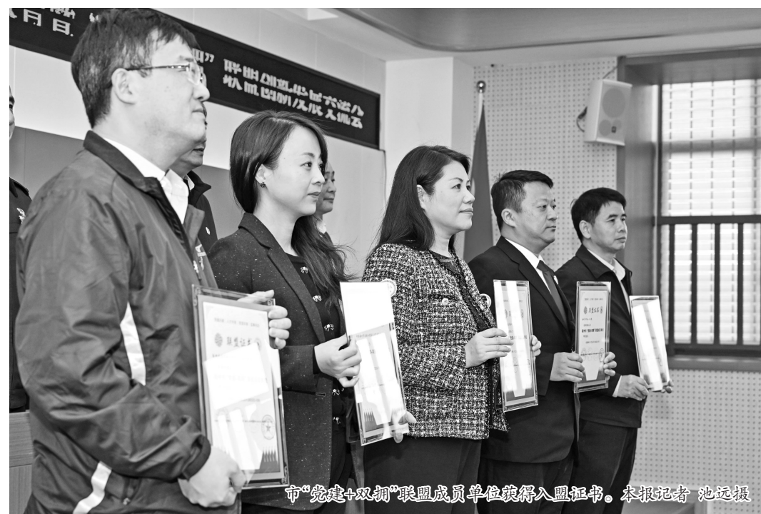
市“党建+双拥”联盟成员单位获得入盟证书。

岗位军转干部多的优势,助推地铁、高铁、机场等军地“双清单”项目建设。市城乡建设局、市房管局、市国有房产中心、市