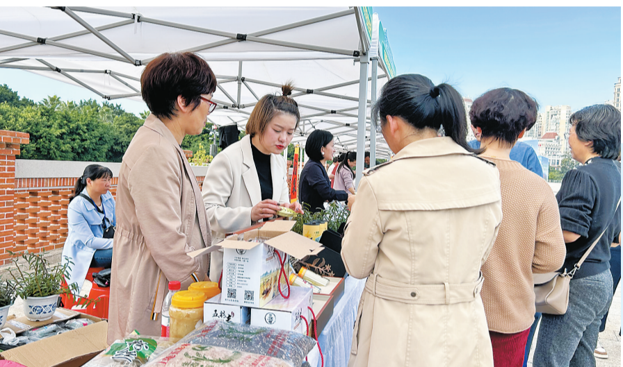
市民在活动现场选购农产品。

齐刷刷亮出“身份证”,市民们纷纷问起价格,热情下单。 “这个二维码不仅是上市农产品的‘身份证’,也是生产者们的‘承诺书’,有了这层保障,消费者们可以直接查验农产品供货商、农药化肥投入品使用情况、检测报告等信息,有效精简了农产品验收流程,实现农产品信息公开透明安全,让消费者买得放心、吃得安心。”市农业农村局质监处相关负责人告诉记者,今年 1 月,新农安法创新建立了承诺达标合格证制度,有效明确了合格证的具体规定和农产品生产者的法律责任,为农产品安全构筑“双保险”。 民以食为天,食以安为先,不断完善的承诺达标合格证制度只是市农业农村局全面推进农产品质量安全监管工作的缩影。 近年来,福州市农业农村局深入学习贯彻习近平总书记“四个最严”以及“产出来”“管出来”和“保数量、保多样、保质量”等重要指示精神,不断加强源头管控,提升预警监测水平,强化执法监管,加强基层监管能力,加大普法宣传力度,深入开展食用农产品“治违禁控药残 促提升”三年行动和豇豆农药残留突出问题攻坚治理专项行动,推进国家级、省级农安县创建,持续提高农产品安全保障水平,不断增加优质农产品供给。 眼下,福州市主要农产品监测合格率稳定在 99% 以上,连续三年在省农业农村厅农产品质量安全监管延伸绩效考核中被评为优秀,并成功创建国家级农产品质量安全县 2 个(福清、罗源)、省级农产品质量安全县 5 个,实现所有县为省级以上农产品质量安全县。 接下来,市农业农村局将持续开展新农安法宣贯活动,让新农安法走到群众身边,走进群众心里,提高群众法律意识,确保农产品买得更放心、吃得更安心。