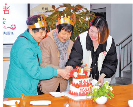
寿星初生蛋糕。

本报讯(通讯员 夏弘鸿 记者 莫思予)22日,鼓楼区鼓东街道中山社区开展“幸福中山 情暖冬至”冬至敬老长者生日会主题活动。