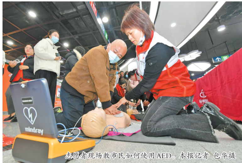
志愿者现场教市民如何使用AED。

本报讯(记者 林文婧)22日,福建省红十字会、福州市红十字会、福州地铁集团有限公司在地铁南门口站举办“救在身边 贴心守护”福州地铁全线网站点配备自动体外除颤器(AED)启用仪式。福州地铁配备了99台AED,覆盖全线网站点。自动体外除颤器能自动分析心率,在必要时通过电击让紊乱的心跳恢复正常,可极大提高心脏骤停者的存活率,又称“救命神器”。活动现场,省红十字会的急救培训师现场为地铁员工及现场市民开展心肺复苏技能、家庭急救知识普及和培训。