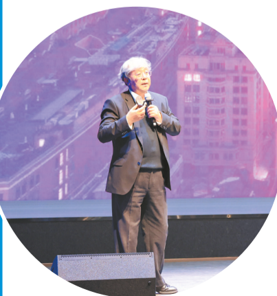
中国工程院院士吴志强发表主旨演讲。

“老百姓到底需要什么,城市到底需要什么,城市的生命力到底在哪里?这些事情都需要我们不断地去想去。”中国工程院院士吴志强带来“城元宇宙 梦想成真”开场演讲,通过城元宇宙、仙元宇宙和海元宇宙三个案例,分享元宇宙如何在城市规划中发挥重要作用。在他看来,城市规划尺度必须回到人的尺度和人的需求。数字时代带来的红利,就是可以用数字来共建人的愿景与梦想。