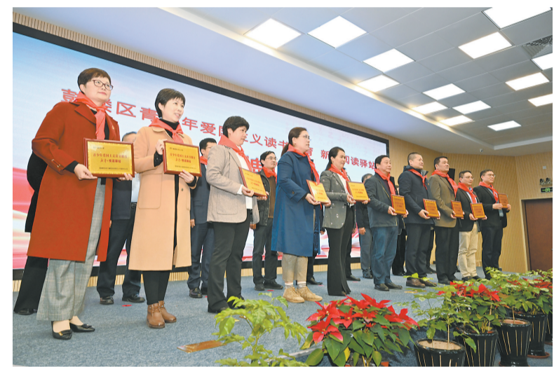
鼓楼区“青少年爱国主义读书教育新华阅读驿站”授牌仪式。