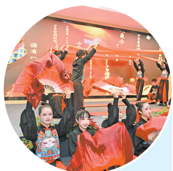
▲学生深情演绎原创诗情景剧《坊巷,方向》。