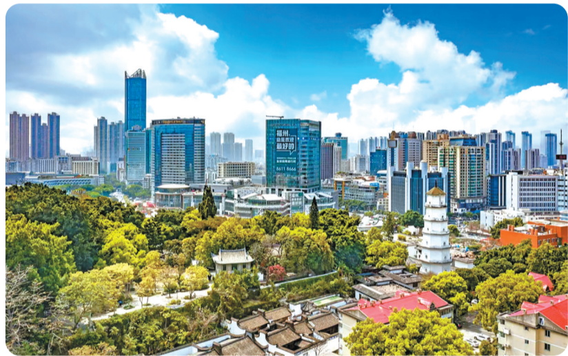
香格里拉中心打造TOD城市公园综合体。

数字园区,打造全省未来产业先导区;依托新能源科创中心推动“四网四流”融合发展,打造新能源运营管理先行区;海洋经济科创高地迎来升级,打造全省海洋科技会客厅…… “稳”可预期,扩大内需是关键——鼓楼落实新时代民营经济强省战略,以消费升级引领供给创新,在消费投资相互促进上加力加效。 鸟瞰鼓楼,欣欣向荣。 香格里拉酒店旁,办公楼已试运营,购物中心加紧装修,一座TOD(以公共交通为导向的城市空间开发模式)城市公园综合体呼之欲出。今年,鼓楼将重点发展数字消费、绿色消费等新模式,引进各类首店、旗舰店100家以上,培育福品门店100家以上,深化建设国际消费中心城市核心区。