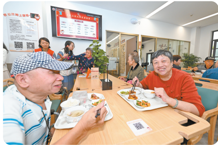
大凤山社区长者食堂。