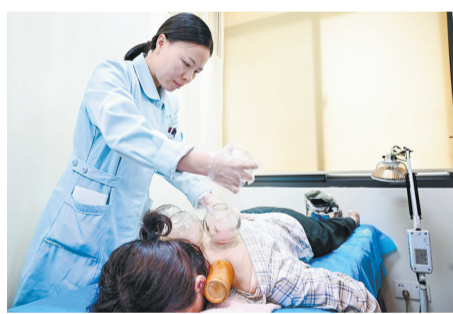
福州中医馆遍地开花。

作为将患者留在基层的重要举措,如今在福州,家庭医生已成为群众身边的“健康守门人”,辐射范围也从城区延伸至海岛、山区。而这正得益于福州在全省首创的“积分制”家庭医生签约服务,全市近1500名专科医生与基层医疗机构全科医生组成家庭医生团队,开展“全科+专科”的“积分制”家庭医生签约模式,提供疾病诊疗、健康管理等服务,并在全省率先推进家庭病床服务。全市家庭病床服务医疗机构增至160所,打造“医院—社区—家庭”全闭环