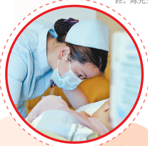
市一总医院护士开展临终关怀。

去年底,孟超肝胆医院成功开展肝移植手术,这是福州市属公立医院首例肝移植手术,也是孟超肝胆医院获批肝脏移植执业资格后的首例肝移植手术,将为终末期器官衰竭患者带来希望。