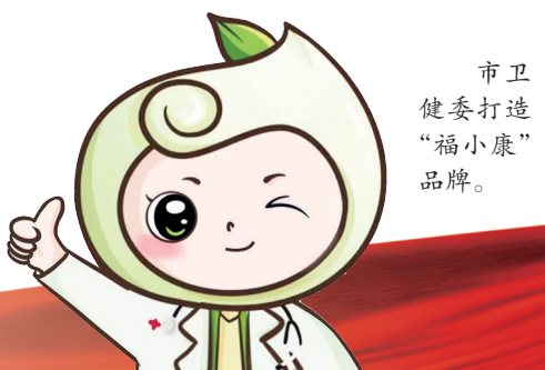
市卫健委打造“福小康”品牌。

“到2025年,我市将实现每千人口拥有0~3岁婴幼儿托位数不少于4.5个,切实减轻家庭生育、养育负担,让3岁前的孩子获得优质就近的看护。”市卫健委有关负责人表示,在有福之州,将有越来越多的0~3岁婴幼儿获得普惠性托育服务,更多双职工家庭的育儿负担得以减轻。