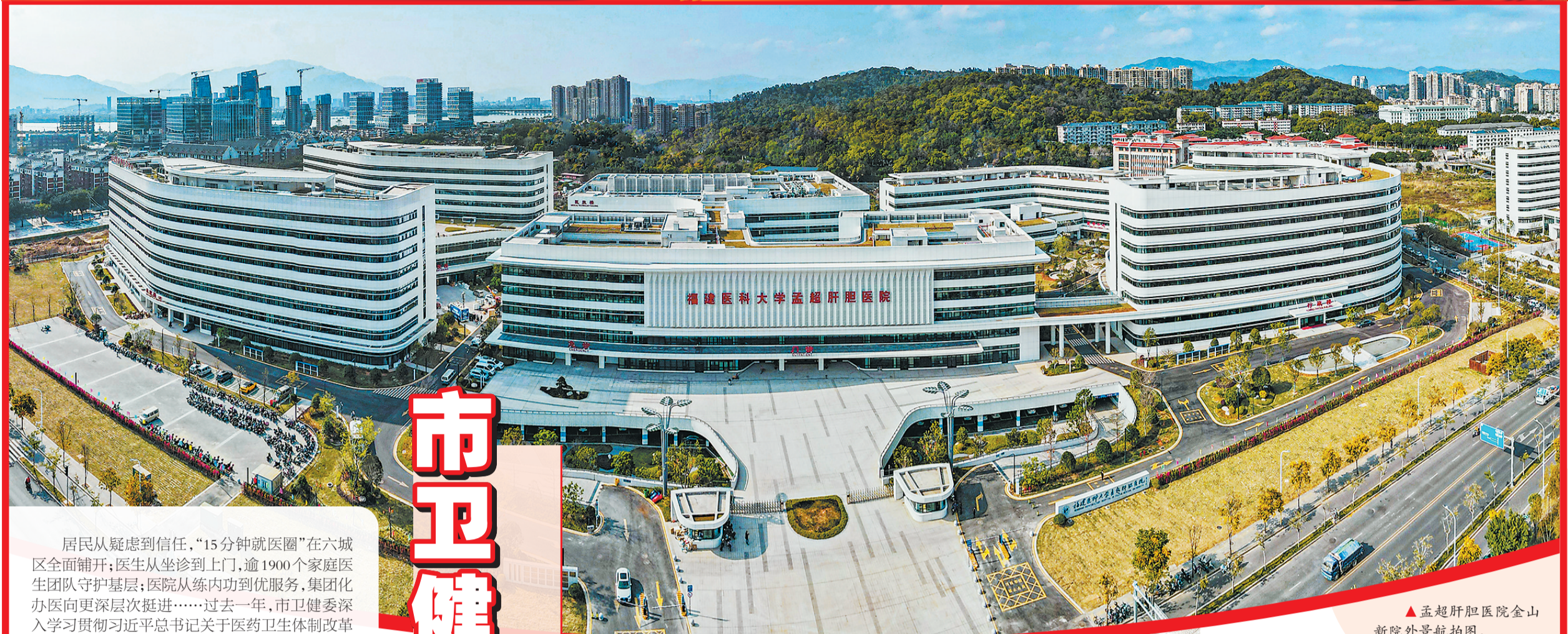
▲孟超肝胆医院金山新院外景航拍图。