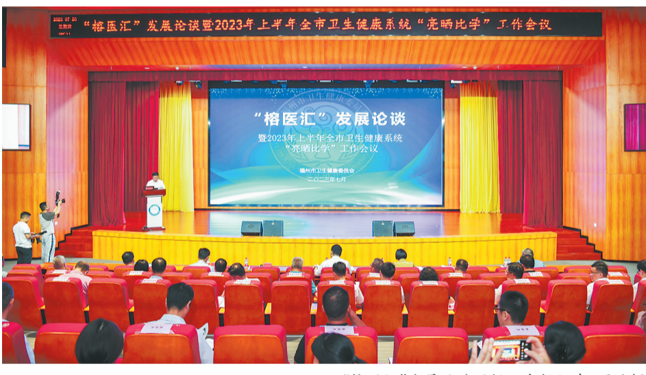
“榕医汇”发展论坛现场。