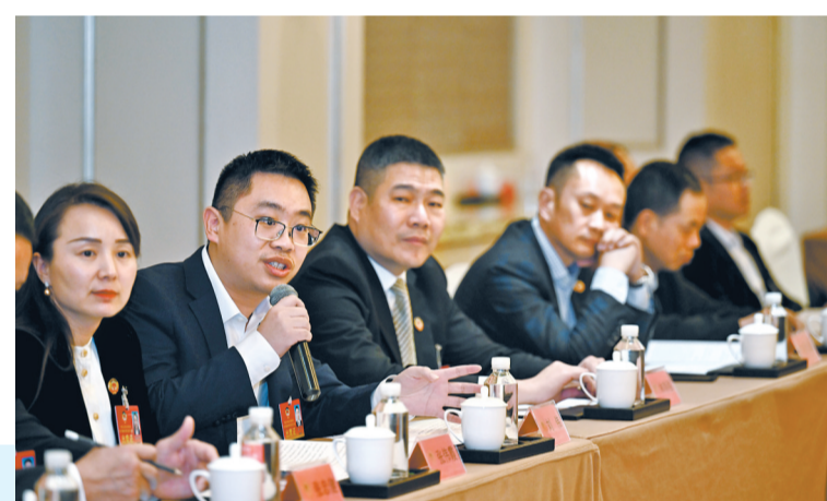
政协委员分组讨论。