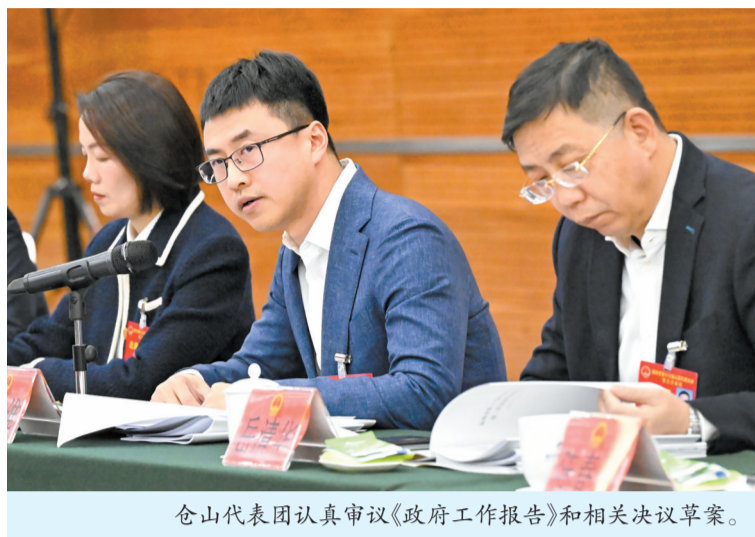
仓山代表团认真审议《政府工作报告》和相关决议草案。

代表们还认为,《福州市人民代表大会关于动员全市人民奋力建设更高水平的可持续发展城市的决议(草案)》及时把市委决策部署转化为全市人民的共同意志,动员和组织全市人民踊跃投身建设更高水平的可持续发展城市火热实践,意义重大、影响深远。计划和财政报告实事求是地总结了过去一年的工作,对今年的工作安排重点突出、针对性强,完全赞成。