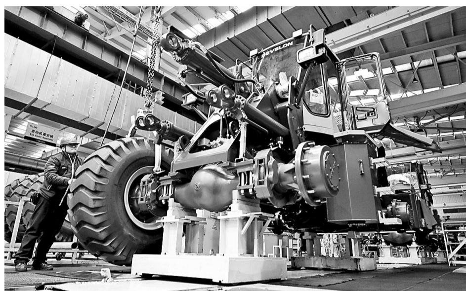
在现代迪万伦工程机械有限公司,工人在流水线上生产装载机(2023年12月26日摄)。

化运行,消费重新成为经济增长的主动力。数据显示,2023年,最终消费支出对经济增长的贡献率达到82.5%,比上年提高43.1个百分点。