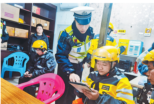
交警指导外卖骑手在平板电脑上签订安全文明骑行承诺书。

本报讯(记者 张铁国)临近春节,外卖骑手每天的业务量更大了。与此同时,市区车流量增大,也给他们的骑行安全带来挑战。4日下午,福州交警宣传小分队来到台江中亭街一家美团外卖配送站点,开展电动自行车骑行交通安全宣传活动,为10余名外卖小哥“送安全”。