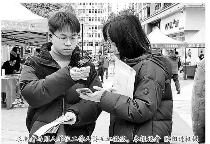
求职者与用人单位工作人员互加微信。

本报讯(记者 欧阳进权 通讯员 严孟翔 兰彦雨 江超云)27日上午,以“就业帮扶 真情相助”为主题的马尾区2024年“春风行动”招聘会在马尾区市民中心广场举行,腾景科技、上润精密、海文铭等63家优质企业,为求职者提供3045个岗位,涵盖生物医药、服装加工、精密光学、新能源储能等行业。