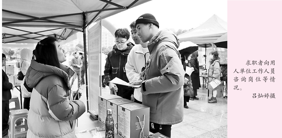
求职者向用人单位工作人员咨询岗位等情况。

据统计,招聘会当日上午吸引3.4万人进入直播间参加线上招聘活动,线下发放宣传册、岗位信息表等各类宣传材料1060份,103人达成初步就业意向。