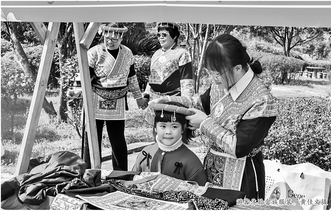
游客体验民族服装。

带动了中房镇乡村旅游经济的发展。 “大集当天就来了300多名游客。自1月13日乡村旅游专线开通以来,到目前为止,已经有1.8万名游客前来旅游观光,带动了本地旅游经济的发展。”陈乐堤说。