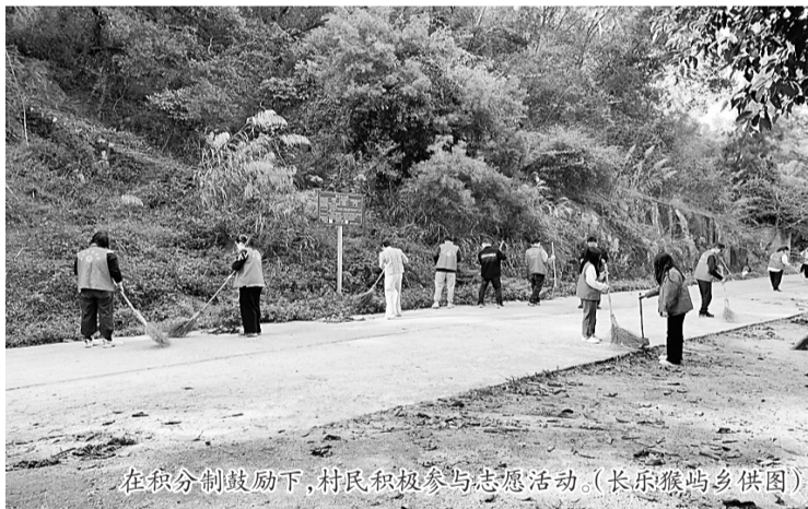
在积分制鼓励下,村民积极参与志愿活动。

工作研发出的新功能。去年7月,为了提升积分管理效率及使用便捷程度,长乐区上线人居环境整治智慧积分运营平台,数字猴屿APP的“智慧福分”小程序率先入驻,迅速在猴屿乡各村全面推广使用,开