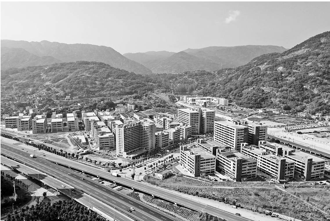
马尾万洋众创城建筑拔地而起。

“现在每个月都有好几家企业入驻,年产值超亿元的企业已经超过7家。”昨日,在位于马尾亭江的长安投资区,福州马尾万洋众创城科创有限公司总经理苏德重说。