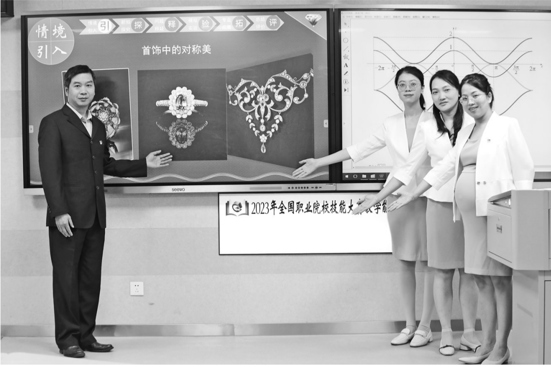
福州财金职专教学团队获全国职业院校技能大赛教学能力比赛二等奖。

国家级课程标准研制组专家,省级名师名校长、专业带头人,全市学科专业教研组长,全国教师技能大赛获奖选手……当这些人云集学校,成为你的科任教师,你愿意跟着学吗? 仓山区闽江大道上,坐落着“沿海发达地区一所精雕细刻的精品学校”。它就是首批公办国家级重点职业中专学校——福建省福州财政金融职业中专学校。学校秉承“好教师是学校的基石”的理念,始终坚持把教师队伍建设当作学校的头等大事,培养了一大批师德高尚、爱岗敬业、业务精湛、成绩突出的优秀教师。名师领航逐光而行,也成就了学校“南国奇葩,职教楷模”的美誉。