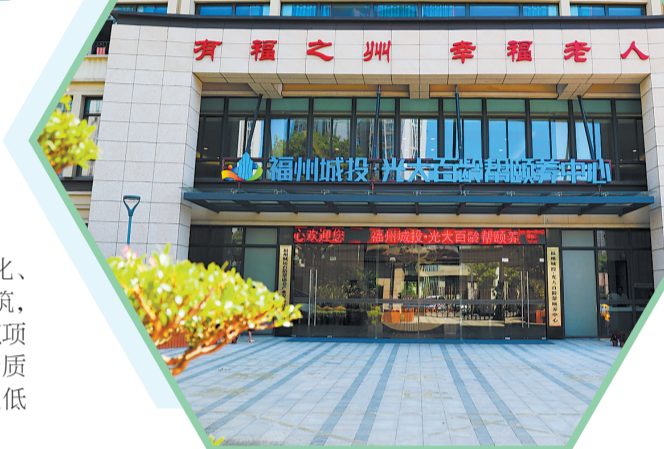
福州城投·光大百龄帮颐养中心。