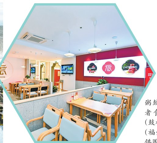
福州城投福粥鼓楼庆城长者食堂·学堂(鼓楼旗舰店)。