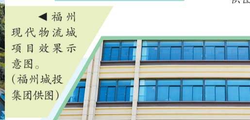
福州现代物流城项目效果示意图。