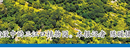
建设中的三江口植物园。