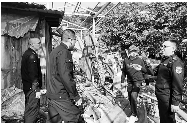
福州市“两违”综合治理

“今年政府工作报告提出‘推动外贸质升量稳’,为我们指明了工作方向。”市贸促会相关负责人表示,将结合“中国福州国际招商月”创办30周年等重要节点,鼓励本土企业走出去参展、抱团出海,帮助企业不断扩大全球“朋友圈”。