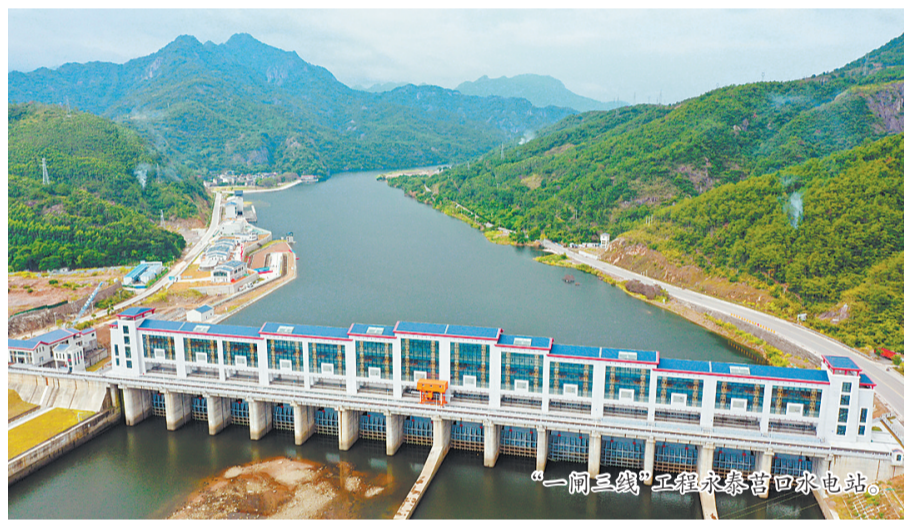
“一闸三线”工程永泰霍口水电站。

乘着绿色东风，农业也迎来新一轮升级。光阳蛋业在永泰投资建设金蛋工程二期，探索鸭蛋养殖数字化、标准化，并有效实现稻鸭联农、有机肥链接李梅产业等。