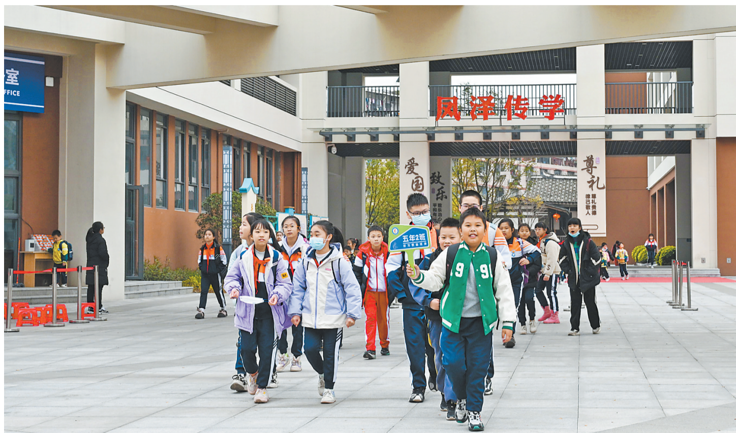
全新投用的冯宅中心小学。

在更广阔的时空维度上，过去一年，福州机场二期扩建工程建设进度加快，并频频登上央视。项目建成后，将支撑福州机场实现旅客吞吐量3600万人次、货邮吞吐量45万吨，为福州乃至闽东北发展提供坚实支撑。