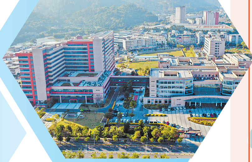
福建医科大学附属协和医院旗山院区（西院）。