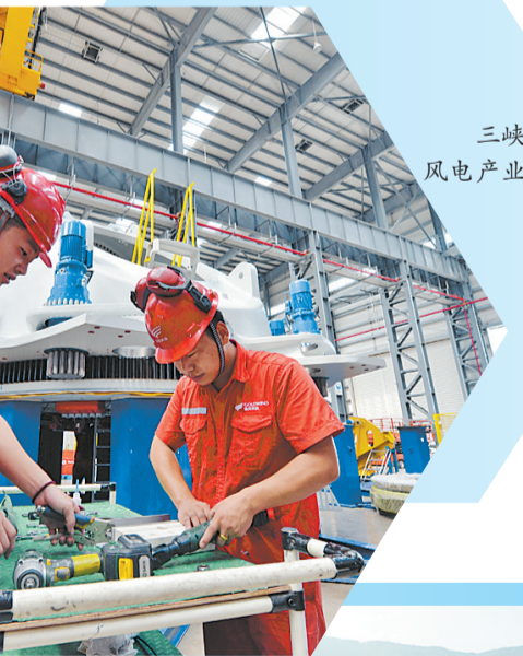
三峡海上风电产业园。

在三江口片区，三江口植物园（一期）兰花谷景观绿化以及植物生活馆、兰香馆等主要建筑物的装饰装修工作有序推进，项目预计年底建成。作为福州“城市绿肺”，三江口植物园未来将同时拥有滨海湿地与滨江湿地的生态格局。