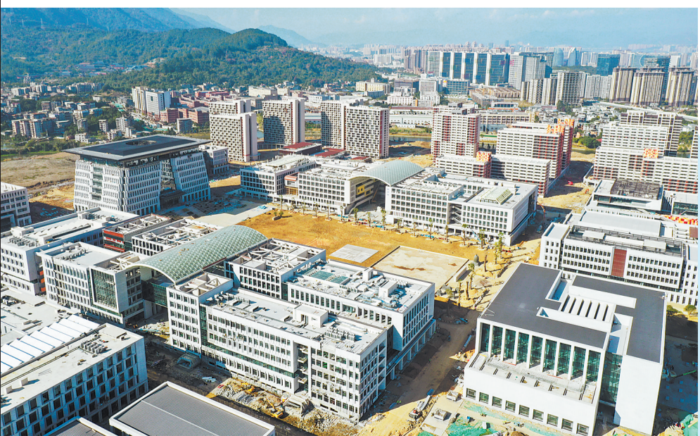
福耀科技大学（暂名）。

2023年，我市引进高质量产业项目 728项 ，完成审批 2728个 前期节点，完成拆迁 2.37万户520.54万平方米 、交地 6.43万亩 ，推动 889个 项目开工建设、 641个 项目建成投产，实施 197个 重点技改项目。