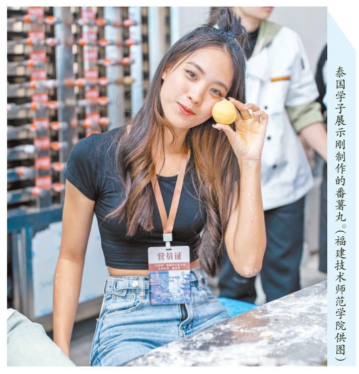
泰国学子展示刚制作的番薯丸。

福建技术师范学院相关负责人表示,学校将继续发挥“中文+职业技能”优势,深化中外文化交流,为青年学子构建更多交流平台,持续展现可信、可爱、可敬的中国形象,讲好中国故事、福州故事。