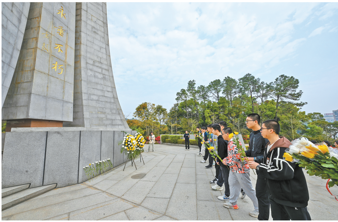
学生代表向革命烈士纪念碑敬献鲜花。

本报讯(记者 曾建兵 通讯员 周建国 陈瀚萍)昨日,随着一场气势恢弘、震撼人心的红色音乐剧场快闪活动在文林山革命英烈纪念馆上演,福州清明祭英烈系列主题活动拉开帷幕。