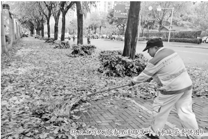
环卫工作人员清理道路落叶。