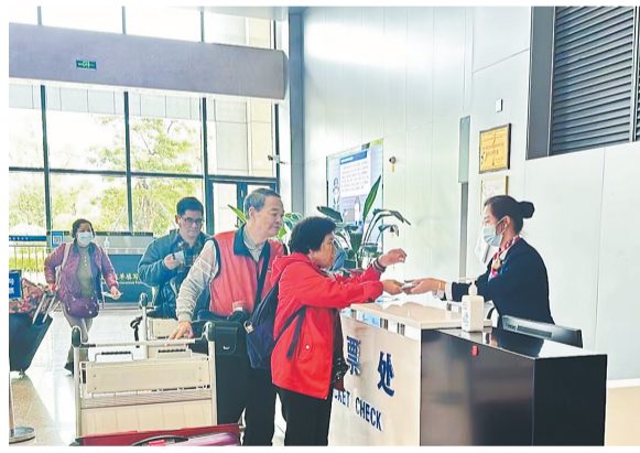
旅客在福州港马尾琅岐客运站办理验票手续。

随着惠台措施陆续落地,闽台间探亲、访友、经商等交流活动更加密集。目前,福建拥有厦门至金门、泉州至金门、马尾琅岐至马祖、连江黄岐至马祖等四条“小三通”客运航线。接下来,我市将聚力推动政策落地实施,支持福州与马祖融合发展,打造福马“同城生活圈”,共建两岸交流最活跃、情感最融洽的第一家园。