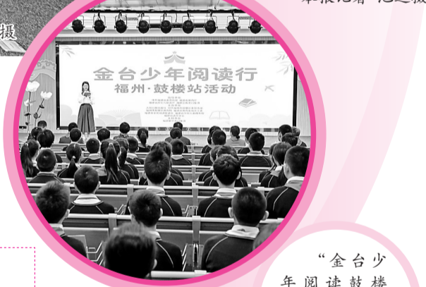
“金台少年阅读鼓楼行”活动现场。