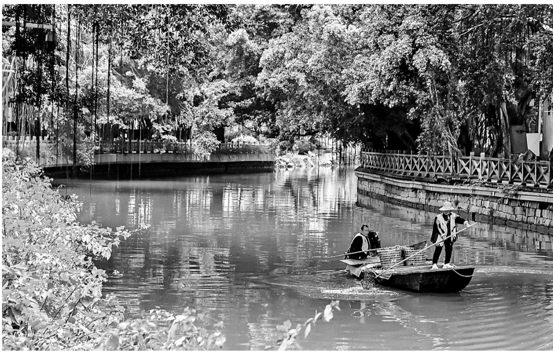
排口“蓝转绿”有利于进一步提升内河水质。

“所谓雨污合流,就是在晴天时排口的闸门关闭,附近的截流井负责接收该排口上游汇集的污水,再通过管网送至污水处理厂进行处理。遇上台风暴雨天气,该排口就得打开,确保满足排水防涝的需求。”该工作人员介绍,排口的“蓝转绿”,能进一步提升内河水质,护好水清河畅,还能提