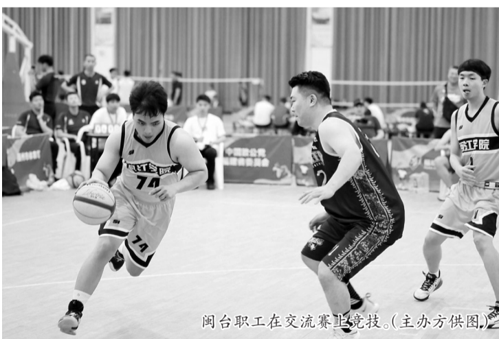
闽台职工在交流赛中竞技。

致公党福建省委直属省体育局支部相关负责人表示,本次活动旨在充分发挥工会团结联系职工群众作用和致公党侨海资源优势,邀请台湾岛内职工队伍,在闽