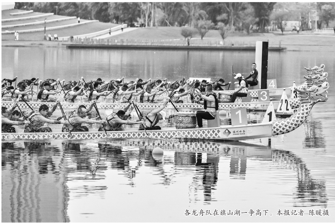
各龙舟队在旗山湖一争高下。