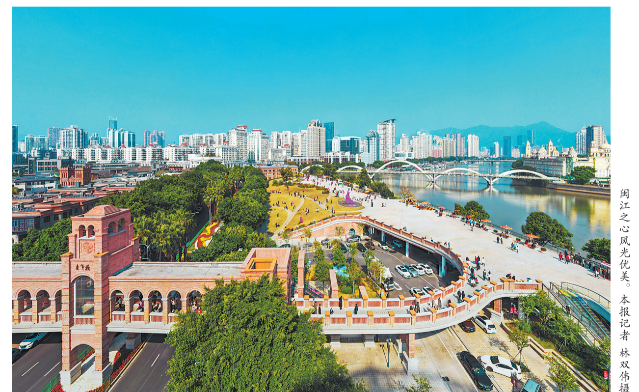
闽江之心风光优美。

山村举办有福之州·一起“村”游——2024福州美丽乡村旅游季暨海峡两岸乡村艺术节开幕式;5月1日至5日,在长乐洞江湖公园举办2024长乐洞江湖全民趣玩生活节;5月1日至5日,在梅花古城举办首届合乐文化旅游季之梅花篇;5月1日至3日,在长乐区石屏村举办“乐见石屏 自在野趣”2024长乐石屏村乡村生态旅游季;4月30日,在携程度假农庄举办“自然永泰·漫享民宿”永泰民宿旅游季;5月1日至5日,在旗山湖公园举办五一游园会;4月30日至5月3日,在井水度假村举办罗源首届鲍鱼丰收暨千人鲍鱼宴万人游井水活动启动仪式等。