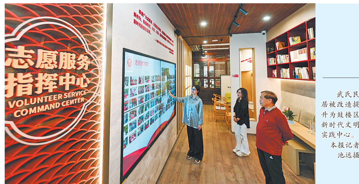
武氏民居被改造提升为鼓楼区新时代文明实践中心。

的马鞍式山墙、夯土墙身和乱毛石墙基,以及大量精美景雕。通过它,市民游客可以了解福州清代及民国时期古民居的建筑形制和风格。