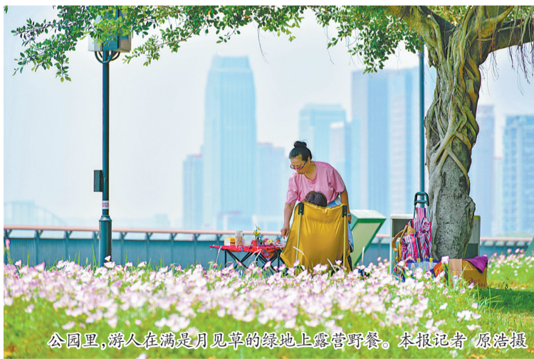
公园里,游人在满是月见草的草地上露营野餐。