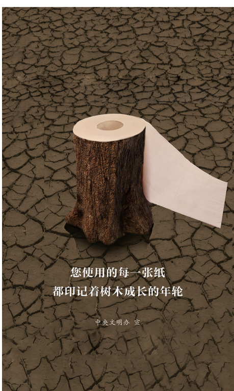
您使用的每一张纸都印着树木成长的年轮。中央文明办 宣

据悉,福州航空目前在福建投放运力12架次,主要执行福州、厦门前往西南、西北、华北、东北等主要城市重点航线,同时也带动更多旅客来“有福之州”游福山福水,做“有福之人”,感受山水相融、历史悠久的闽都文化。