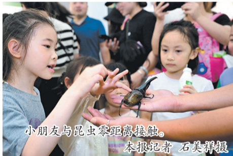
小朋友与昆虫零距离接触。

昆虫馆的开放时间为每周一至周日的上午9点至下午5点,欢迎广大市民和自然爱好者前来参观体验。