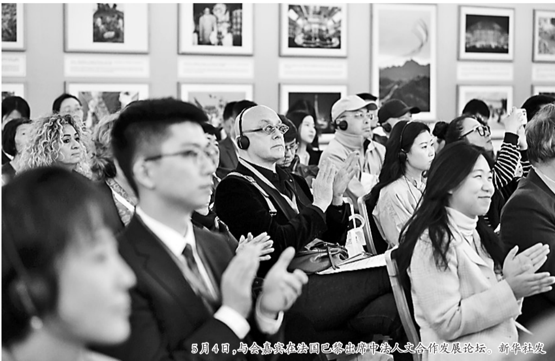
5月4日,与会嘉宾在法国巴黎出席中法人文合作发展论坛。

“中国式现代化不仅具有基于自己国情的鲜明特色,更有广泛深刻的世界意义。”《中国式现代化发展之路》智库报告4日在法国巴黎举办的中法人文合作发展论坛上发布后,引发中法两国专家学者和企业界人士热议。