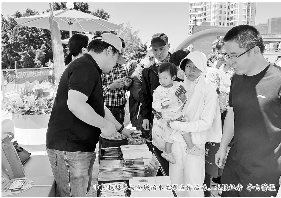
市民积极参与全域治水主题宣传活动。

“福州市林则徐治水奖”是个新奖项。治水奖为何以福州历史文化名人林则徐命名?那是因为他林则徐的卓越功勋除了众人皆知的“虎门销烟”,还有治水。在他长达40年的为官生涯中,足迹踏遍大江南北,黄河、长江、海河、珠江、太湖和伊犁等地都有他主持完成的水利建设。创设林则徐治水奖,既体现了法规的福州特色,也彰显了一种传承。