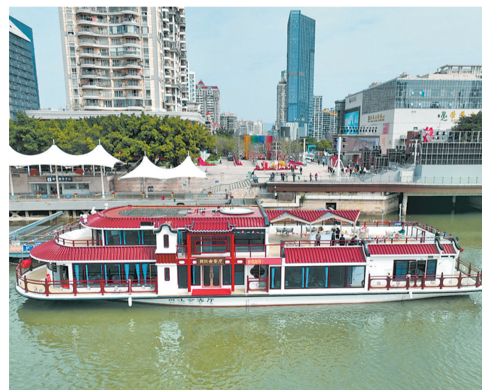
福建首艘自主设计建造的纯电动大型高端客船——“闽江会客厅”在闽江首航。

数字,让宜居城市更幸福,让社会治理更智慧。台江区有关负责人介绍,下一步将以长效运营为原则,以适度超前的方式建设“城市大脑”平台硬件底座、能力中台,围绕城市治理、民生服务、产业发展开发应用系统,打造“会思考、促改革、有获得感”的信息化平台,加快打造能办事、快办事、办成事的“便利台江”。