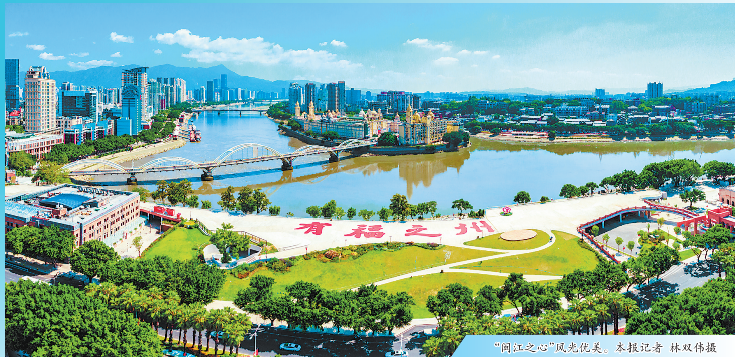
“闽江之心”风光优美。本报记者 林双伟摄

这个春天,新质生产力成为中国经济大潮中强劲涌动的一股新浪。台江区主动融入国家数字经济创新发展试验区建设,把数字经济作为主攻方向,通过大数据、云计算、人工智能等数字技术激活新质生产力,将新技术、新模式、新业态融入生产生活各个领域,为加快打造活力商都、滨江福地,高水平建设现代化国际城市核心区注入澎湃动能。