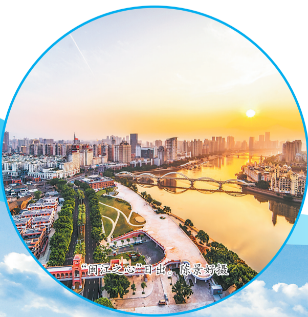
“闽江之心”日出。

因数字而变,因数字而兴。台江区有关负责人表示,将以数字中国建设峰会在榕举办为契机,抢抓发展机遇,以更开放的姿态、更务实的行动,加强与各方合作交流,吸引更多创新团队、数字人才集聚台江,全力营造近悦远来的营商环境,共同构筑具有国际竞争力的数字创新生态圈。