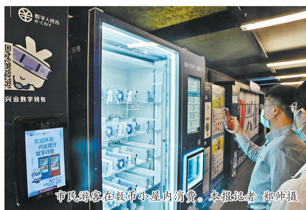
市民顾客在数币小屋内消费。