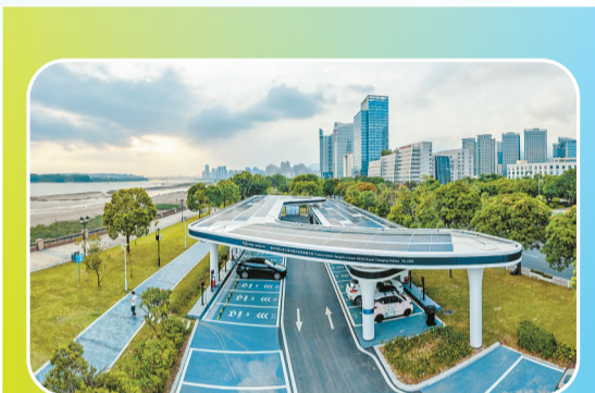
位于马尾东江滨的最美光储充检智能超充站。

在2022年度和2023年度的全省政务公开工作第三方评估中,马尾区均位居福州市第一。马尾区有关负责人说,将牢记习近平总书记“马尾的事,特事特办、马上就办”的嘱托,持续打造一流营商环境,以数字峰会等重大活动为契机,全方位、多层次开展客商邀请、项目签约,掀起一轮又一轮抓招商、促发展的热潮。