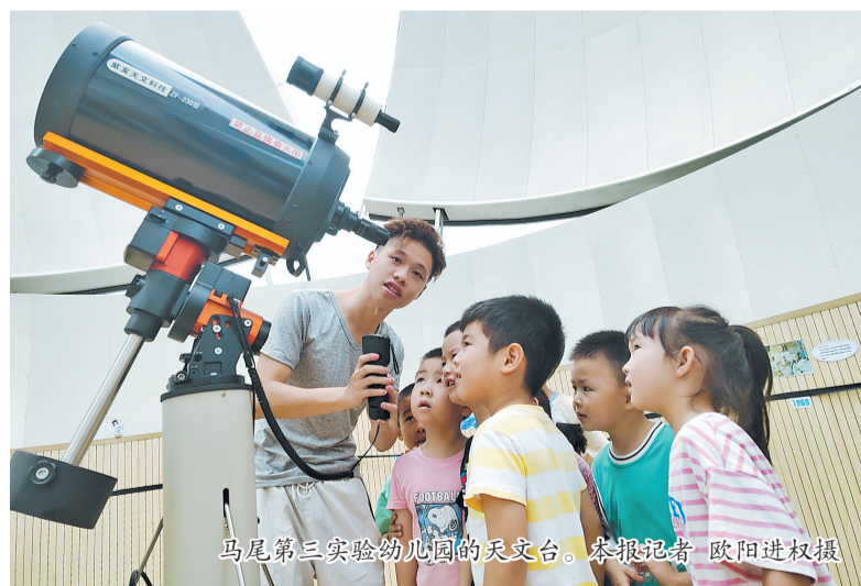
马尾第三实验幼儿园的天文台。