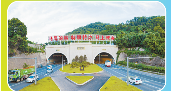
在马尾隧道,“马尾的事,特事特办、马上就办”巨幅标语引人注目。