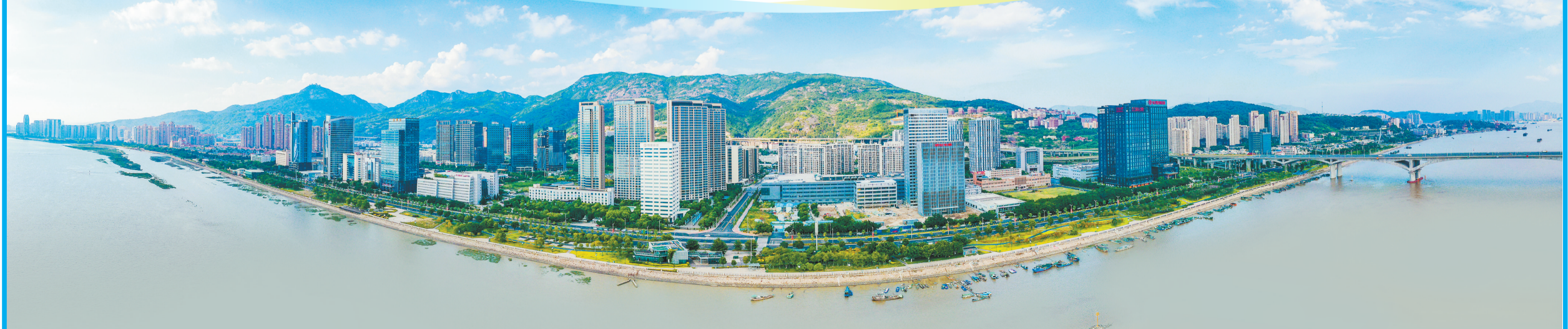
马尾东江滨大道全景。