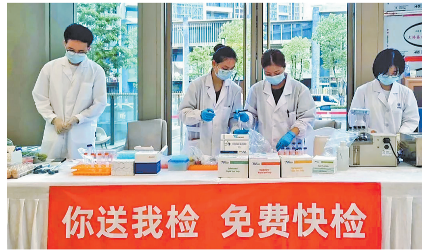
你送我检 免费快检