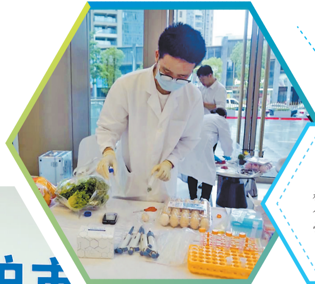
食品安全检测人员开展食品安全现场快检。

如今,福州的成熟经验又上升为制度设计。2023年,福州在全国率先制定外卖监管长效机制,出台《福州网络餐饮服务管理办法》,从立法层面明确订餐平台法律责任。去年11月,福州市市场监管局与江苏盐城市市场监管局签署合作备忘录,共建以e治理电子证照为基础的政企协同共治模式,网络餐饮智慧监管“福州经验”开始在省外开花结果。