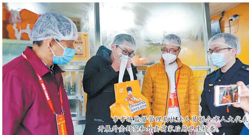
市市场监管局执法人员联合市人大代表开展外卖封签和外卖商家后厨卫生检查。

近年来,我市网络餐饮市场爆发式增长,5年市场体量增长20倍,全市日均订单量30余万份、一年1.3亿份,常年位居全国前列。1.3亿的订单量给外卖食品安全监管出了一份难度不小的“试卷”。为了答好这份试卷,福州创新“网络餐饮e治理”模式,上线外卖电子证照库,唤醒沉睡的政务数据,让数据奔跑在监管第一线,充当网络餐饮监管“哨兵”。