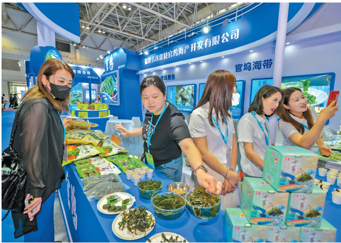
连江县展位展出官坞海带。

2024海峡(福州)渔业周·渔博会昨日启幕,面对这个全球性的专业渔业展,连江32家企业组团参展,展现全国海洋大县的硬实力。本届渔博会,连江5个项目参与海洋渔业重点项目、海洋科技“揭榜挂帅”项目签约仪式,总投资额近百亿元。