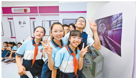
孩子们在金山站体验地铁驾驶员工作。

本报讯(记者 林榕昇 通讯员 王鑫焱)昨日上午,“红领巾爱祖国”六一主题活动暨“共享童趣 启梦未来”福州地铁儿童主题车站启动仪式在地铁5号线金山站举办。福州地铁首个儿童主题车站——金山站正式亮相。本次活动由市政联指导,福州地铁联合金山小学主办。