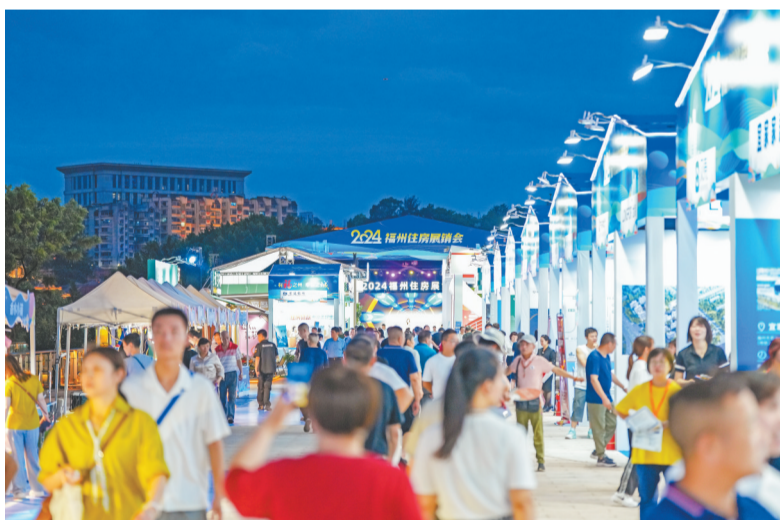
住房展销会吸引众多市民参观。

本报讯(记者 赖志昌)昨日,以“有福之州 幸福之城”为主题的2024福州住房展销会在闽江之心青年广场开幕。本届住房展销会由市房管局、福州日报社主办,福州新闻网承办。展会为期3天,核心面积约7000平方米,是福州首次举办户外大型住房展销会,同时增设夜间场,给市民带来更潮流、更便利的逛展体验。