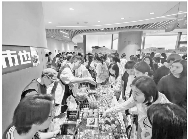
福州碳水自由市场人气满满。

记者注意到,来赶集的大多是年轻人。“近几年,福州有趣的市集越来越多,只要在社交媒体上刷到创意市集消息,我都会来逛逛,经常能遇到心仪的商品。”