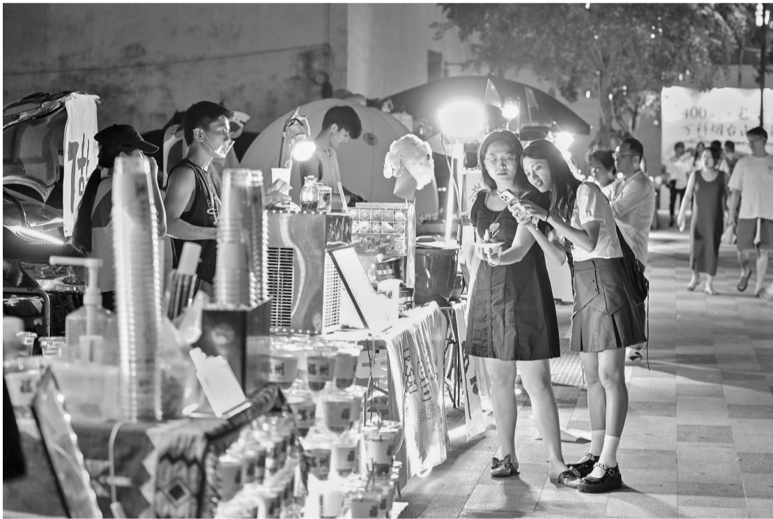
市民在烟台山市集购物。

碳水自由市场、咖啡市集、手帐市集、宠物友好市集……若问最近福州年轻人周末去哪里,不少人会回答“赶集”。当下,在福州的城市公园、商业综合体等,不同主题的特色创意市集走红,吸引众多年轻人前去消费打卡。