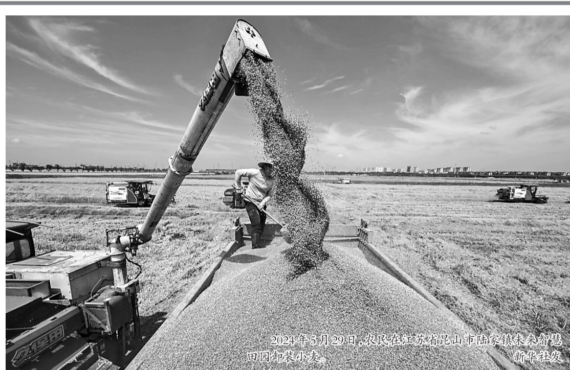
2024年5月29日,农民在江苏省昆山市陆家镇未来智惠田园收获小麦。

这位负责人说,下一步,“三北”工程攻坚战将抓住重点项目这个“牛鼻子”,强化项目前期工作和联合审查,成熟一批推出一批,并建立项目包片指导机制,强化项目监管,深入一线抓进度、保质量;加强保障性苗圃和草种生产基地建设,确保种苗等价格平稳和及时有效供应;科学配置林草植被类型和密度;积极推广伏沙治沙等新模式,推出一批生态、经济、社会效益俱佳的绿色低碳发展示范项目;持续加大科技支撑,组织科技力量向“三北”工程进军。