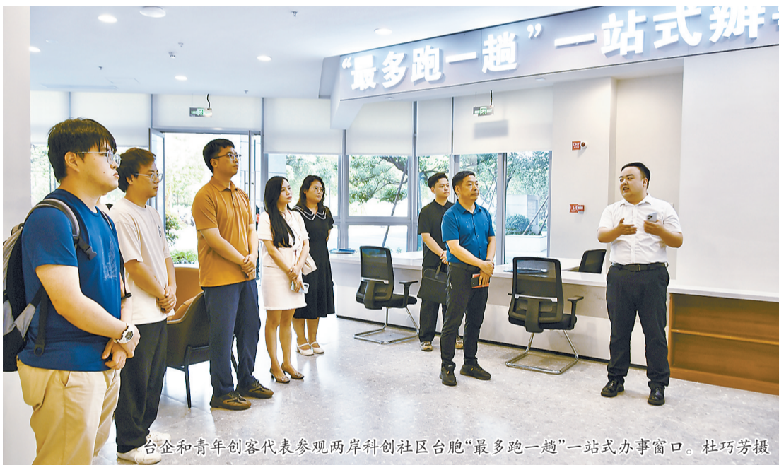
台企和青年创客代表参观两岸科创社区台胞“最多跑一趟”一站式办事窗口。

和服务机制,力争在建设两岸融合发展示范区先行城市中走前头、作表率,热诚欢迎更多台湾青年到福州高新区交流、学习、创新、创业。