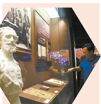
中国船政文化博物馆里的日意格塑像。

魏延年介绍, 在当晚交流会上, 来自法国国立路桥学校、国立巴黎高等矿业学院、国立高等先进技术学院、巴黎政治学院、国立东方语言文化学院、法兰西人文科学院、法国国家海军博物馆等高等教育和文化机构的60余位中法人士参加。这些高校大多从19世纪70年代开始接收来自福建船政的中国学子, 其中包括陈季同、马建忠、魏瀚等知名校友。